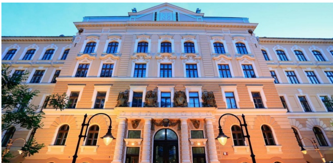
Actualul sediu al Muzeului Țării Crișurilor situat pe strada Armatei Române nr. 1/A, fosta Școală Regală de Cadeți de la începutul sec. XX

muzeu de secol XXI. S-a luat în considerare atât ca spațiu de expunere să fie suficient, dar mai ales cel de depozitare, laboratoare etc. În urma vizitei miniștrilor Culturii și Apărării, în data de 9 iulie 2005 s-a decis să fie dată în folosința muzeului, pentru a deveni noul sediu, clădirea principală a Garnizoanei din Oradea (corpurile A și A1). Proiectată de către arhitectul Ignác Alpár în stil eclectic și finalizată în anul 1898, a fost în perioada imperiului Austro-Ungar Școală Regală de Cadeți. După Mare Unire din 1918, aici a avut sediul comandamentul central al Diviziei 11 infanterie motorizată 25 . În perioada comunistă a servit drept parte din ansamblul Garnizoanei orădene UM 01326. Din cauza diverselor probleme care nu au avut legătură cu muzeul, mutarea (atât întreg patrimoniul cu toate colecțiile, cât și birourile și laboratoarele de restaurare împreună cu personalul) a fost făcută de abia în 2018. În următorii doi ani, pe lângă organizarea a mai multor expoziții cu caracter temporar, s-a reușit în toamna anului 2020 să se deschidă oficial primul etaj: expozițiile de bază ale secțiilor de arheologie și științe naturale. Celelalte două etaje urmează și ele să fie inaugurate, prezentând piesele și artefactele celorlalte secții (istorie, artă și etnografie).