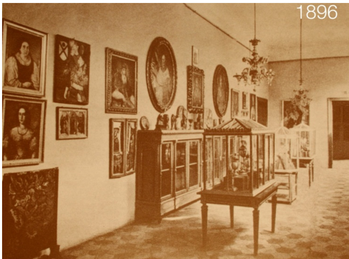
Imagine cu expoziția originală deschisă în 1896, una dintre sălile Colecției Ipolyi

popularizarea științei arheologice și istorice, cum vom realiza țelul nostru încă nu știu dar cunosc drumul pe care vrem să pornim și vă garantăm cu ocazia acestei sărbători că invitații noștri își vor îmbogăți cunoștințele...” 17 . Expoziția, care a rămas practic neschimbată chiar și după Primul Război Mondial, a fost organizată în nouă săli distincte: șase din ele au reprezentat doar piese provenind din colecția Ipolyi (aproximativ 1.700), restul fiind obținute prin donații sau descoperiri arheologice.