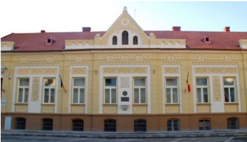
Muzeul Memorial „Aurel Lazăr”, clădire construită la sfârșitul secolului al XIX-lea, situată pe strada Aurel Lazăr nr. 13