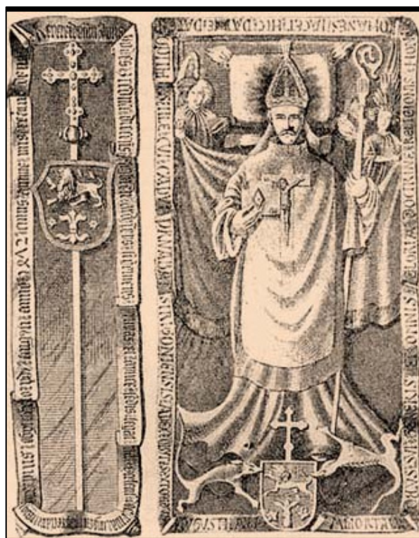
Fig.2. Blazonul lui Ioan Vitéz de Zredna pe mormântul de la Strigoniu