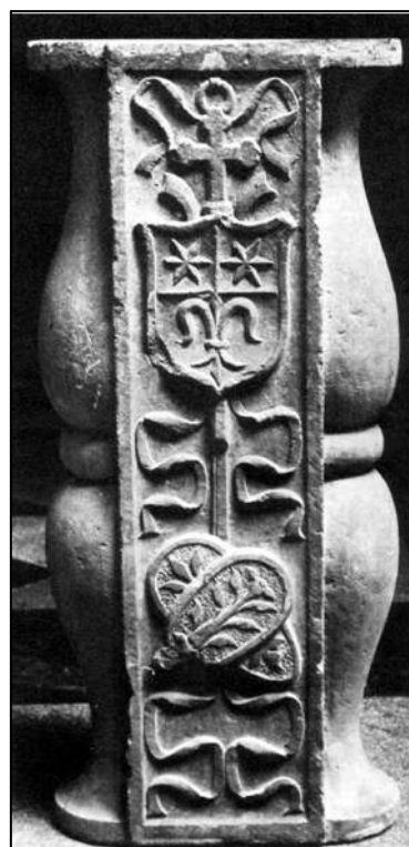
Fig.3. Blazonul lui Váradi Péter