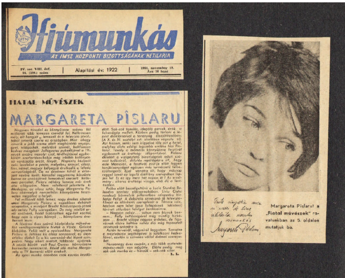
Fig. 2: Două dintre publicațiile la care uteciștii erau abonați, Scinteia Tineretului și Ifjűmunkás (Tânărul muncitor) , care abordau atât subiecte politice și propagandistice, cât și cultural-artistice