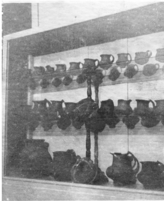
„Depozitul de vase” – în muzeul Andrassy (1954)