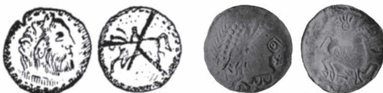
Fig. 5. Monede dacice de la Piatra Craivii (1 – tip greu identificabil; 2 – tip Aiud-Cugir) (după Roska 1944 - 1; Berciu et al. 1965 - 2)