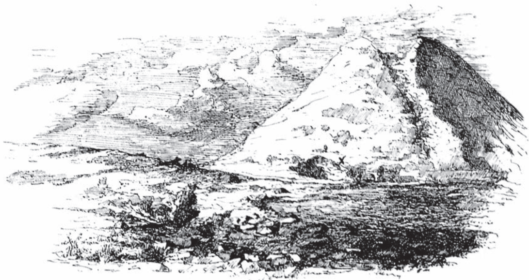
Fig. 3. Bucium. Imagine cu muntele Corabia și șanțul Ieruga (apud Téglás 1890)