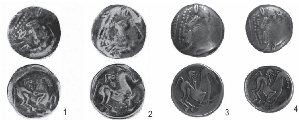
Fig. 2. Monede de tip Aninoasa-Dobrești: locuri necunoscute – Cabinetul Academiei Române (1-2) și colecția Alexandru Borza Alba Iulia (3-4) (apud Preda 1973 – 1-2; Suciu 2003 – 3-4)