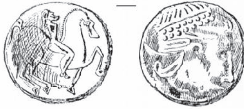
Fig. 1. Monedă geto-dacică de tip Aninoasa-Dobrești de la Bucium-Corabia (apud Téglás 1890)