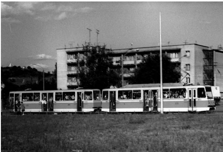
Fig. 11. Condiții de transport inumane! Asemenea sardelor într-o cutie de conserve, muncitorii călătoresc înghesuți în tramvai, de la locul de muncă la domiciliu și invers. Era în anul 1983! Vehiculul a fost surprins în zona străzii Celor trei Crișuri și Clujului unde la începutul anilor 1970 mai exista bucla de întoarcere a tramvaielor liniei 1. În planul îndepărtat se distinge Dealul „Ciuperca”.

Cu o vechime apreciabilă, de circa 20-30 de ani, acestea s-au dovedit a fi corespunzătoare din toate punctele de vedere unui transport local civilizată, în condiții de confort și de siguranță mult mai bune față de cele oferite de Timișuri. De-a lungul anilor au sosit mai multe asemenea tramvaie, din Magdeburg, Dresda și Berlin, până ce parcul a devenit din nou unitar ( Fig.15 – Nr.crt. 1-6) 69 .