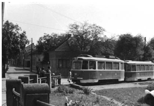
Fig. 9. Primăvara anului 1981: garnitură ITB, circulând spre Zona de Vest (Cartierul Rogerius) trece în dreptul capătului Podului Decebal, de pe malul drept al Crișului Repede. Puntea în sine se afla în proces de demolare, ca urmare a avarierii sale în martie a aceluiași an 64 .

deviată pe str. Aviatorilor. Deși transportul călătorilor spre cimitir și Episcopia-Bihor a fost preluat de autobuze, cel efectuat cu tramvaiul în părțile centrale a dispărut definitiv 65 . În 1975 este lichidată vechea linie simplă de pe str. Dimitrie Cantemir. În loc s-a construit o linie dublă – pentru început până la pârlău Peța, iar până în 1979 până la capătul străzii Nufarului 66 .