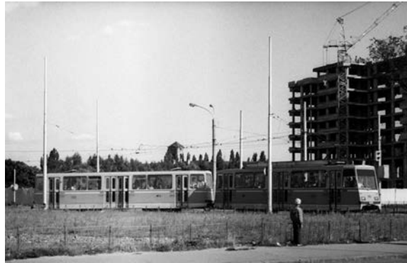
Fig. 10. Garnitură de tip Timiș 2 circulă pe linia 4 în 1983. În planul îndepărtat se poate observa turnul bisericii din Cetate și imobilul în construcție cu menirea de a ascunde privirii fortăreața de ev mediu.

La începutul anilor 1990 numele transportatorului în comun devine Oradea Transport Local (în continuare, se va cita: OTL ). În acea perioadă se desființează linia din strada Progresului, șinele de aici sunt scoase. Ceva mai târziu se renunță și la linia din Calea Clujului, una din cele mai vechi din oraș. Cu această ocazie a fost pecetluită și soarta serviciului de transport mărfuri cu locomotive electrice, cu alte cuvinte a fost distrus odată pentru totdeauna un sistem ce funcționa din 1882 68 .