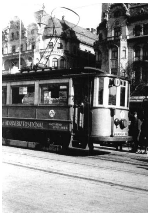
Fig. 3. Vagon motor de tip Siemens surprins pe linia D, în timpul celui de Al Doilea Război Mondial. În planul îndepărtat se distinge Complexul Vulturul Negru.

cu tramvaiul către Cimitirul Rulikovszky a devenit posibilă spre sfârșitul perioadei de criză economică, prin prelungirea relației str. General Moșoiu (azi, Avram Iancu)-Grădina Rhédey ( Fig.3 ). 37 De altfel, lucrările la această extensie au început în 1929 38 . Din aceeași relație trebuia să mai derive o linie spre abator, însă în ciuda tuturor avizelor obținute, planul a fost sortit eșecului 39 .