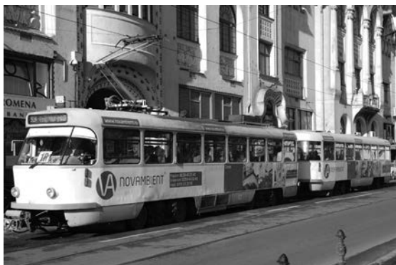
Fig. 13. Adusă din Dresda, garnitura de tip Tatra T4D-B4D străbate strada Independenței, transportând călătorii grăbiți. În țara de unde a venit, Germania, s-ar constitui piesă de muzeu!