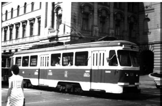
Fig. 8. Într-o zi de vară, în urmă cu aproape 30 de ani, garnitura de tramvai, având în componență vagonul automotor de tip EP-V54 (cunoscut și sub apelativul de „săgeata roșie”), din direcția loșia, sosea în stația de la Sfatul Popular.