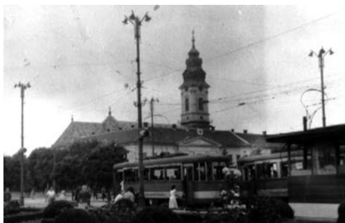
Fig. 6. Războiul s-a terminat. Poftiți în vagoane! Tramvaiul cu indicativul 42 pornește din stația situată în Piața Malinovszki (mai înainte, Szent László). În anul 2015 autoguvernarea locală a supus această piață transformării radicale, după bunul său plac și spre nemulțumirea unei mase mari a orădenilor.

transportul de mărfuri, patruzeci și cinci de vagoane feroviare închise și altele cinci deschise 52 . Cele două bombardamente ale aviației aliate, abătute asupra locului, ca și trecerea trupelor româno-sovietice au provocat pagube mici vehiculelor de transport public. De suferit însă a avut calea de rulare, mai ales pe străzile Árpád vezér și Clujului. Mai mult, trupele germano-maghiare în retragere au aruncat în aer podul de peste Crișul Repede, din centrul istoric, pe unde circula tramvaiul 53 . A fost afectată, deci, legătura de tramvai cu Olosigul. Destul de serios a fost avariat și Podul Baross (azi, Dacia) care nu avea linie ferată. Pentru asigurarea transportului public în această parte a orașului, s-a găsit o soluție ingenioasă: un număr de tramvaie au fost tractate până la stația principală de cale ferată, utilizând linia destinată transportului de mărfuri și podul de cale ferată de peste Crișul Repede din loșia, reparat între timp. Pentru a se stabili legătură cu linia A, având capătul chiar la stația de cale ferată, s-a construit o linie facultativă. În Piața Széchenyi (azi, Parcul Traian) s-a amenajat o mini-remiză descoperită, cu scopul garării vagoanelor peste noapte 54 .