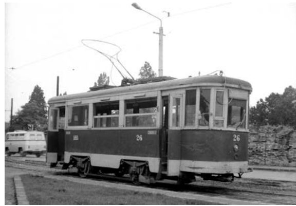
Fig. 7. Unul din ultimele vagoane motor modernizate, de tip Siemens, surprinse lângă Cimitirul Olosig. Era în anul 1974!

stabilizării monetare 59 . Cea de-a doua cale își avea unul din capete la intersecția străzilor Decebal și Aradului, se desfășura spre podul metalic din luncă, str. Karl Marx (azi, Menumorut), str. Eroul Necunoscut-Cimitirul Olosig (azi, Parcul Mihai Viteazul), cu punctul terminus Gara Mare ( Fig. 7 ) 60 . Inițial, articolele ziarelor locale titrau cum că linia ar urma să ajungă la Gara Mare de-a lungul străzilor Karl Marx și Muzeului, pe un traseu mult mai scurt. Nu știm dacă această variantă a stat vreodată în picioare, deoarece în stadiul actual al cercetărilor nu am găsit vreun document care să o ateste! Însă, ce se știe cu siguranță este faptul că la început, traficul pe relația construită a fost asigurat de vagoane automotor de construcție proprie 61 .