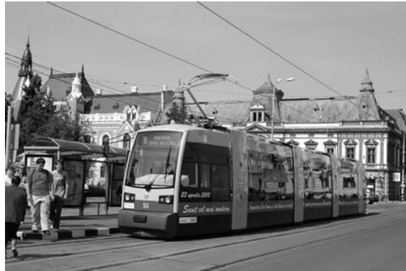
Fig. 16. Primul exemplar din Oradea al flotei Siemens ULF 151 se îndreaptă spre cartierul Nufărul. Reclama de pe caroseria sa nu lasă loc de comentarii: „Sunt cel mai modern tramvai din lume și mă bucur să circule pentru prima oară și în România, la Oradea. Nu sunt singurul, alte tramvaie vor veni în curând”.

Să ne păstrăm trecutul pentru a ne crea viitorul! De acest trecut se leagă vagoanele motor de tip Siemens, având cadrul din lemn, vagoanele motor de tip Electroputere, de tip ITB și de tip Timiș 2 distruse în mod conștient ori din lipsa cunoașterii reglementărilor privind protecția patrimoniului cultural național; clădirea remizei de tramvaie din vecinătatea Cetății, reconvertită în hală agroalimentară; două locomotive electrice destinate transportului de mărfuri, clasate în anul 2013. Să facem cunoscut generațiilor viitoare moștenirea culturală deja distrusă, pe cea încă păstrată și în cel mai fericit caz clasată și protejată prin lege, a Oradiei, oraș, de mai multe secole, multietnic, multicultural și multiconfensional!