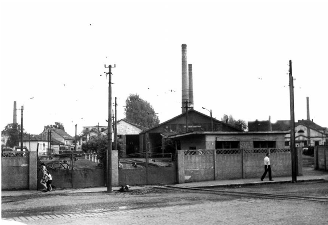
Fig. 1. Ansamblul depoului de tramvaie, în jurul anului 1970. De-a lungul timpului remiza a fost extinsă de mai multe ori. În prezent, în locul său se află Piața agroalimentară „Cetate”.

Autorizația de construcție pentru electrificarea liniilor a fost eliberată la 14 februarie 1905, de către ministerul de resort ( Magyar Királyi Kereskedelmi Minisztérium ). Valabilitatea documentului a fost stabilită ca fiind până la data de 31 iulie 1966 inclusiv, când serviciul de transport mărfuri și de persoane a fost prevăzut a trece în administrarea orașului. Nu s-a întâmplat așa, deoarece au intervenit o serie de evenimente istorice, printre care, aici, nu semnalăm decât schimbările de regim repetate! Pentru investiție au fost alocate 2,1 milioane de coroane. Prima lovitură de târnăcop, ca semn de demarare a lucrărilor, s-a aplicat pe calea Clujului, în vara anului 1905 11 .