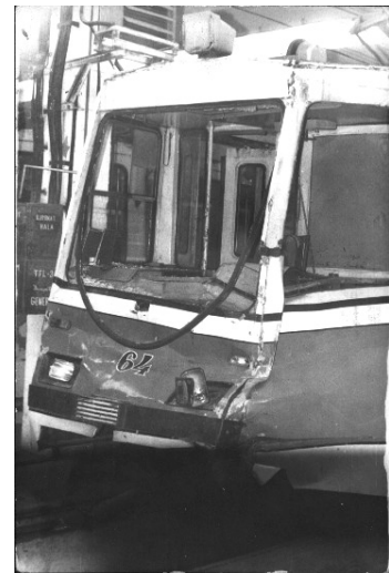
Fig. 12. S-a avariât primul tren-tramvai de mare capacitate, cu zgomot aproape imperceptibil, din Oradea. În urma accidentului în care a fost implicat, s-a hotărât imediat casarea sa.