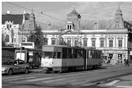
Fig. 14. După deservirea ani în șir a locuitorilor Berlinului, tramvaiul articulat de tip Tatra KT4, înregimentat în serviciul orădenilor, sosește în stația din Piața Unirii. În Occident ar fi fost tot o piesă de muzeu! (Sursa: Nagy István)