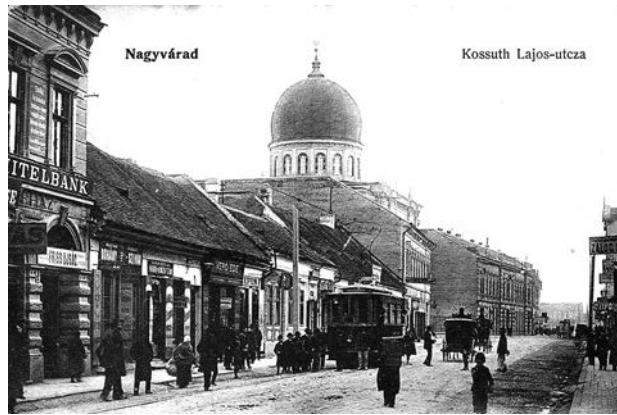
Fig. 2. La bulivar, tramvai, la bulivar!