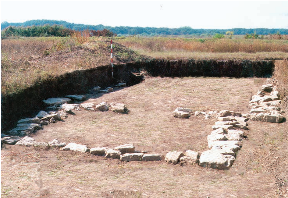
Fig.1. Biserica satului medieval Rădvani. Talpa fundației.