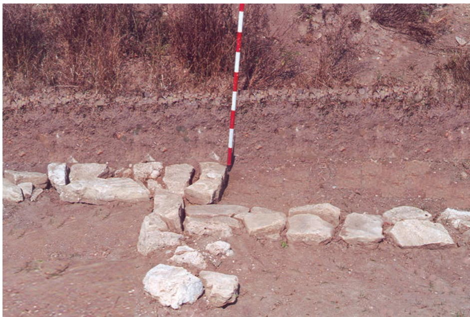
Fig. 3. Biserica satului medieval Rădvani. Talpa fundației peretelui de nord cu decroșul absidei.