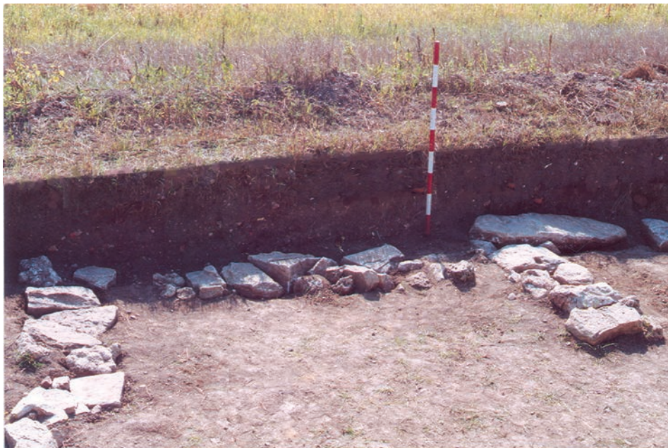
Fig. 2. Biserica satului medieval Rădvani. Talpa fundației peretelui de sud cu decroșul absidei și poziția lespezii funerare.