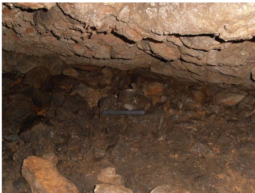
Fig. 3. Depunerea Coțofeni