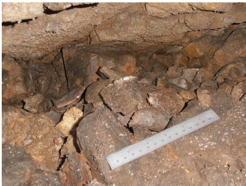
Fig. 4. Detaliu cu depunerea Coțofeni