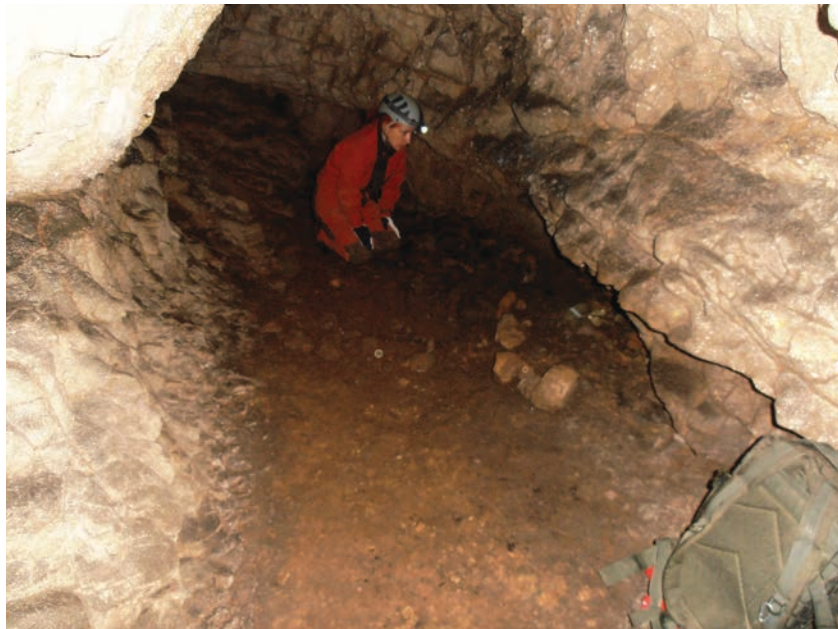
Fig. 2. Galeria cu depunerea Coțofeni