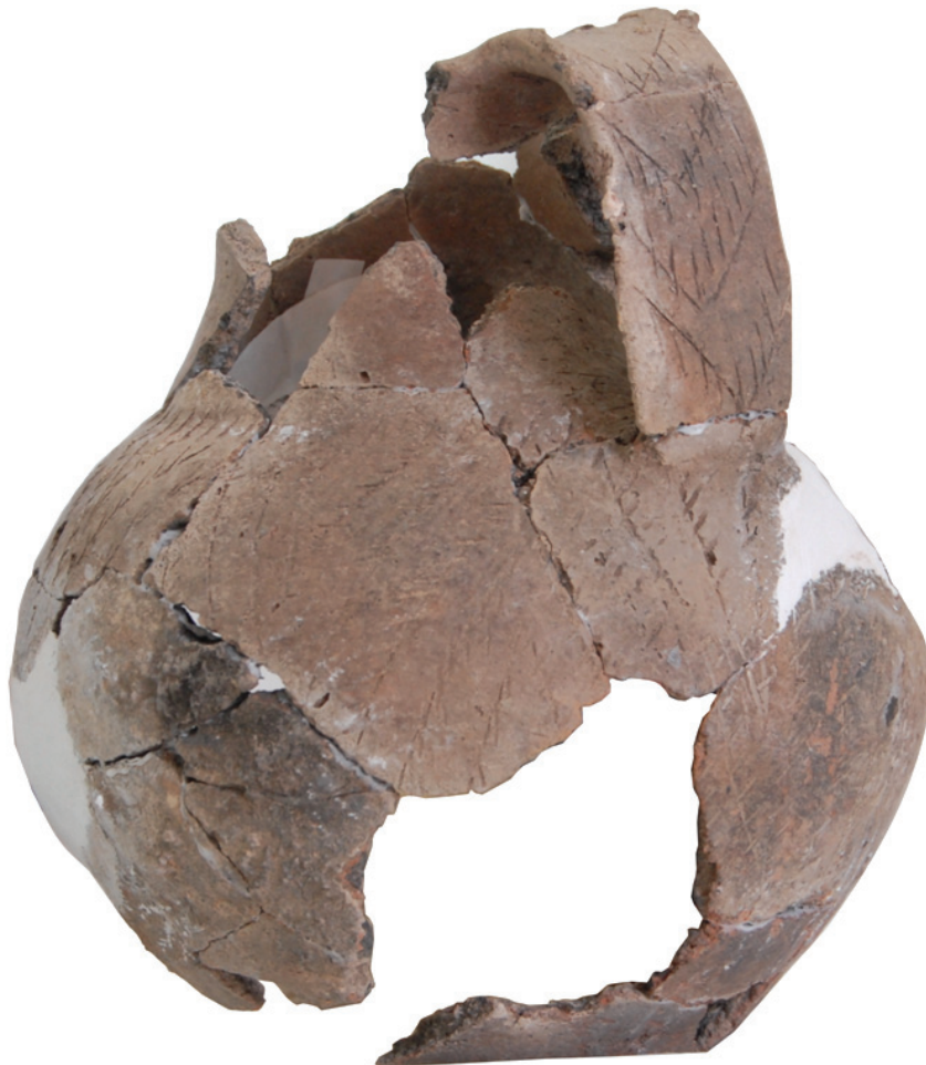
Fig. 6. Cana reconstituită (foto)