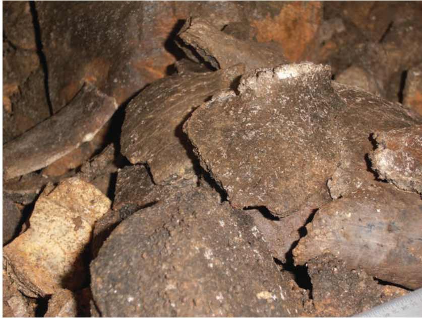
Fig. 5. Detaliu 2 cu depunerea