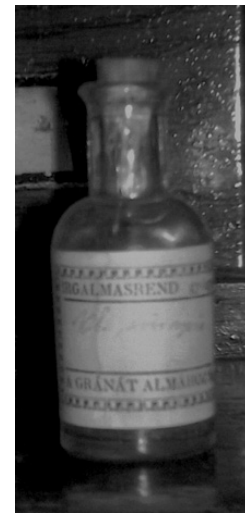
Foto 3 Sticlulă cu dop de plută, conținută în pixidă. Eticheta este inscripționată manual, cu cerneală verde: OL. sinapis.