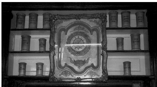
Foto 1 Detaliu din oficina Farmaciei Remedio 58: polițe cu pixide din vechea Farmacie „Rodia”. În centru un frumos ceas muzical, antic de perete.