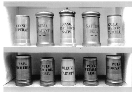
Foto 4 Pixide din colecția de vase de farmacie A.P. De remarcat în rândul de jos, pixida din mijloc: OLEUM CARYOPH[YLLORUM], care, desigur a conținut cândva o sticlulă cu ulei de cuișoare.