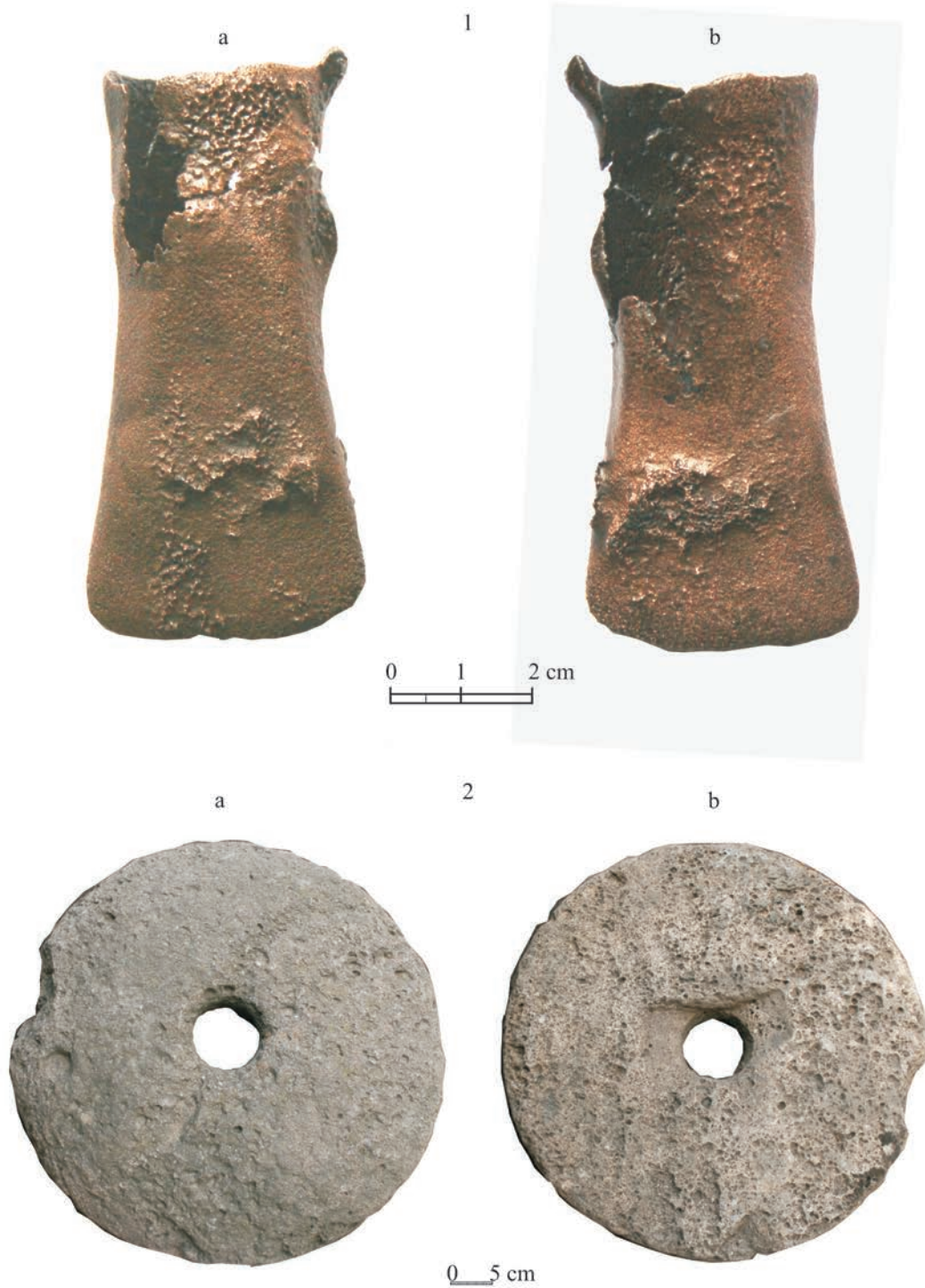
Pl.II.1. a,b, Betfia-Borte, celt. 2. a, b, Betfia-Intravilan, piatră de roată manuală rotativă.