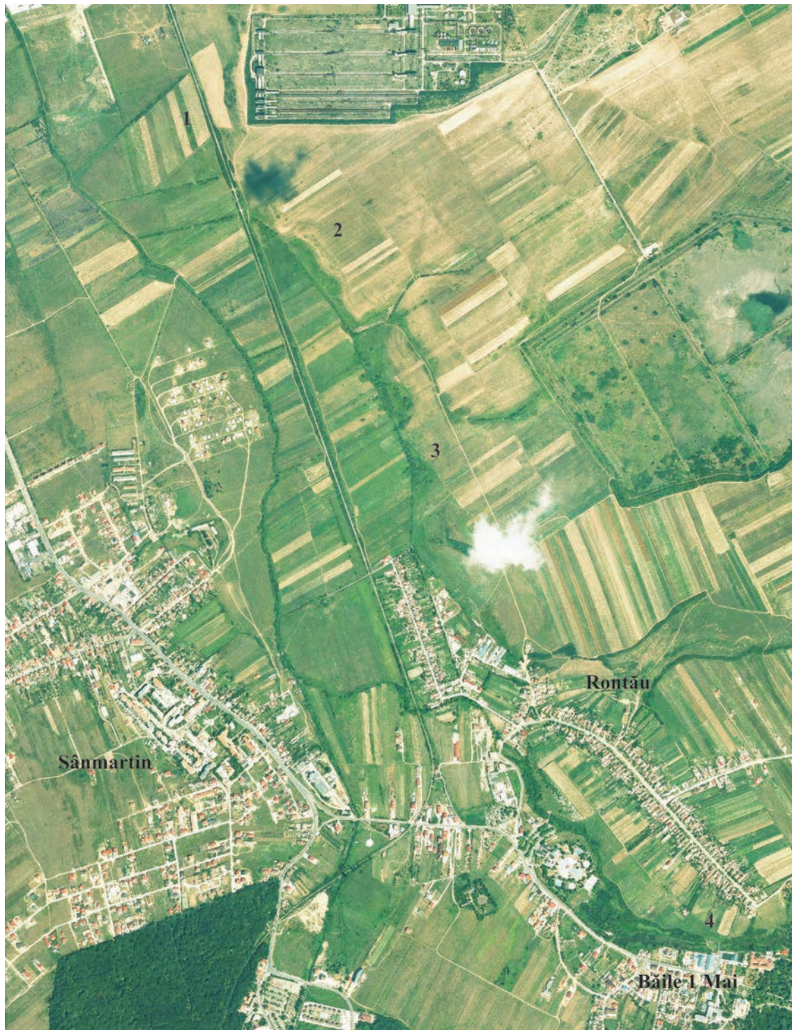
Fig.1. Noi situri arheologice descoperite pe teritoriul comunei Sânmartin. 1.Rontău-La Cruci. 2.Rontău-Dealul Gavrii. 3.Rontău-Ghealogi. 4.Rontău-La Grădini