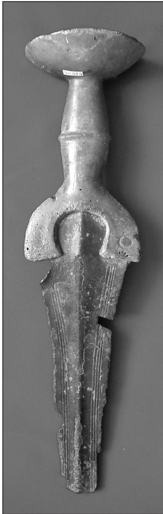
Fig. 2. Spada fragmentară de la Lăpuș (foto). / Abb. 2. Das fragmentarische Schwert von Lăpuș (Photo).