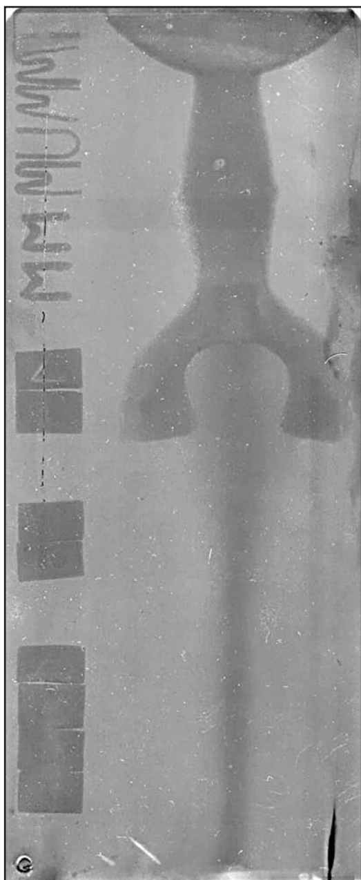
Fig. 3a. Imaginea radiografiată a spadei de la Lăpuș. / Abb. 3a. Die radiographische Aufnahme des Schwertes von Lăpuș.