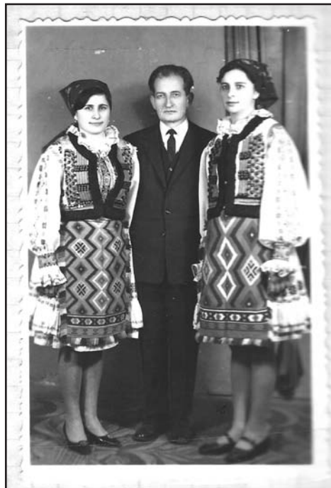
Cu doua eleve la Beiuș